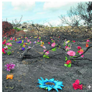
Imagen de una de las obras de la artista.