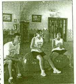
Campus Multideporte de Apadis.

cualquier espacio físico, patio de un centro, campo o playa, lo que permite a su vez un mayor acercamiento del practicante a la naturaleza. El Campus tendrá un carácter vivencial, recreativo y lúdico. Se le dará más énfasis a los aspectos recreativos de relación, cooperación y comunicación entre las personas que a los aspectos relacionados con la competición.